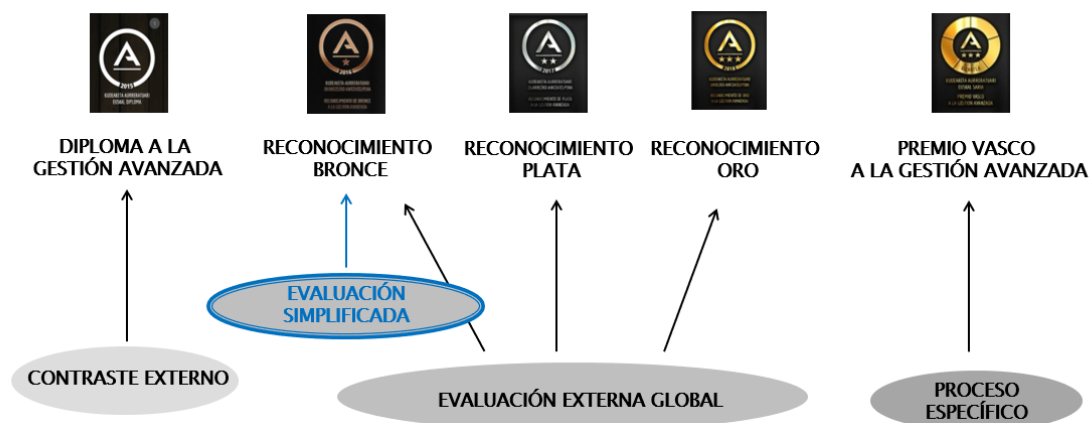
Esquema de acompañamiento y reconocimientos a la gestión avanzada

Una vez que la organización haya recibido el Diploma a la Gestión Avanzada, podrá aprovechar al máximo todos los beneficios del servicio de evaluación externa de EUSKALIT, y acceder además a los reconocimientos A de Bronce, A de Plata y A de Oro a la Gestión Avanzada que otorga el Gobierno Vasco: